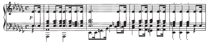
Abbildung 2: Takte 1-4 des dritten Satzes der Klaviersonate Nr.12 von Beethoven (Op. 26 Satz 3).

dennoch deutliche Unterschiede. Zum Beispiel verändert sich zwischen Takt 1 und 3 nicht nur die Harmonie (f-Moll nach C-Dur), sondern auch die Melodie. Während im ersten Takt zwischen der ersten und zweiten Note drei Halbtonstufen liegen (F nach As), findet man an der gleichen Stelle im dritten Takt fünf Halbtonstufen (G nach C). Selbst aus musikwissenschaftlicher Sicht ist nicht im Allgemeinen definiert, wann eine Notenfolge eine modifizierte Variante eines gegebenen Themas darstellt. Alle Modifikationsmöglichkeiten beim Matching in robuster Weise zu berücksichtigen, stellt technisch somit eine große Herausforderung dar.