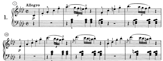
Abbildung 1: Variationen des „Mannheim-Themas“ in den Takten 1-4 und 49-53 des ersten Satzes der Klaviersonate Nr.1 von Beethoven (Op. 2 Nr. 1 Satz 1).

Barlow und Morgenstern verzeichnen in [1] insbesondere Themen, die besonders prägnant für ein Stück sind. Dieser Umstand sollte bei der automatischen Identifizierung berücksichtigt werden. Wenn zum Beispiel ein Thema mehrfach in einem Stück gefunden werden kann, so gibt dies einen starken Hinweis darauf, dass das Stück korrekt durch das Thema identifiziert wird. Dabei ergibt sich jedoch das Problem, dass ein Thema typischerweise nicht in exakt gleicher Form wiederholt wird, sondern stets leicht modifiziert. In Abb. 1 wird dies anhand einiger Takte aus der Sonate Nr.1 von Beethoven illustriert. Das in [1] zu diesem Stück verzeichnete Thema findet sich in der rechten Hand der ersten beiden Takte, eine Variation des bekannten Mannheim-Themas. Dieses Thema wird mehrfach wiederholt, so in den Takten 3 und 4, 49 und 50 sowie 52 und 53. Obwohl die Wiederholungen in sehr ähnlicher Form aufzutreten scheinen, finden sich