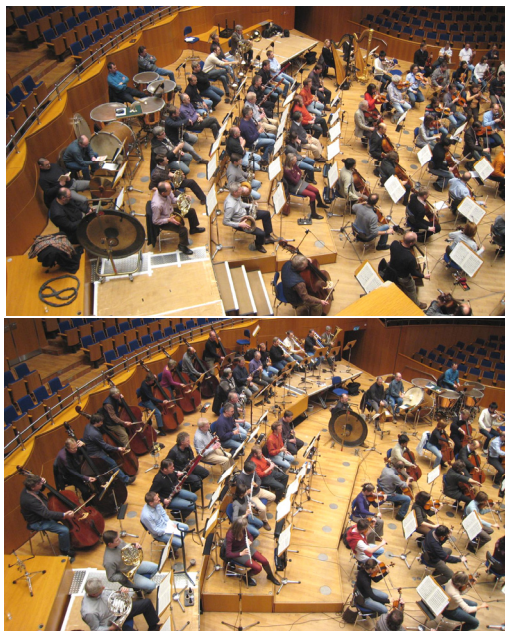
Abbildung 2: Oben: Orchesteraufstellung 1 (Standard) Unten: Orchesteraufstellung 6 (Variante)

Von den sechs untersuchten Aufstellungsvarianten war die erste Variante („amerikanische“) die Standardaufstellung der Düsseldorfer Symphoniker. Bei Varianten 3 und 5 wurden mit unterschiedlichen Streicheraufstellungen Hörner und die anderen Blechbläser seitlich voneinander getrennt platziert und die Abstände vor ihnen von 0,3 auf ca. 2 m vergrößert, wobei die Mikrofone mit den Ohren der nächstgelegenen Musiker mitwanderten. Bei den Varianten 2 und 4 handelte es sich um geringfügig andere Hubpodienstaffelungen, bei Variante 6 wurden die Kontrabässe vor der Podienrückwand positioniert und die Pauken vor den Posaunen, s. Abb. 2.