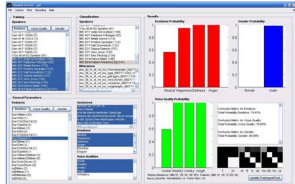
Abbildung 1: Graphische Benutzeroberfläche

Das System besteht aus einer Aufnahmeeinheit, einer Einheit zur Merkmalsextraktion und einer Klassifikationseinheit. Die Steuerung geschieht über graphische Benutzeroberflächen (GUI). Neben einer Hautgui gibt es noch eine weitere zur Steuerung der Live-Klassifikation. Die Oberfläche ist in Abb.1 dargestellt. Im linken Teil der GUI lassen sich alle Einstellungen zu den Klassifikationsanalysen treffen. Diese beinhalten die Wahl der Trainings Sprecher, der zu klassifizierenden Sprecher, der Merkmale und der zu verwendenden Klassen. Über Buttons lassen sich diese Einstellungen für alle drei Klassifikationen separat treffen. Die rechte Seite der GUI ist