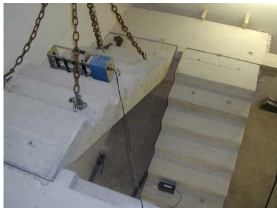
Abbildung 1: Versuchsaufbau - entkoppelte Laulagerung

Es wurden zwei Podeste starr in eine 24 cm Kalksandvollsteinmauer der Rohdichteklasse 1.8 eingebaut. Dazwischen wurde ein 7 stufiger 1 m breiter Treppenlauf ( h = 15 cm) mit 2 cm Wandabstand eingebaut (Abbildung 1).