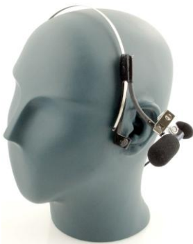
Abbildung 1: Mit dem Kopfbügel kann das Mikrofon des Dosimeters optimal in Ohrnähe befestigt werden. Dies ist hauptsächlich bei ohnhaften Quellen wie z.B. bei den Violinen sehr wichtig.

Bei den Musiklokalmessungen trug die Versuchsperson das Mikrofon jeweils am Kragen. Bei den Musikschullehrern wurde es meistens am Kopfbügel gemäss Abbildung 1 befestigt.