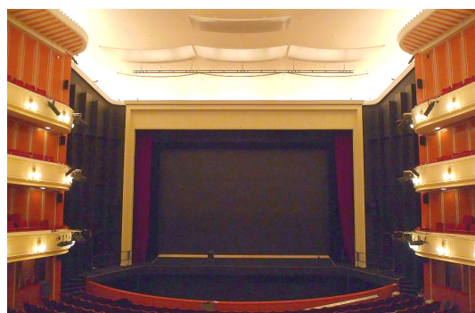
Abbildung 3: DOR, Ansicht mit Maßnahmen seit 2010: neue Reflektoren und neues Proszenium

Durch die Gesamtheit der durchgeführten raumakustischen Maßnahmen im Orchestergraben und im Proszenium der DOR, siehe Abbildung 3, konnten die Reflexionsstrukturen auf der Bühne, im Orchestergraben und im Parkett deutlich verbessert und die Echos deutlich verringert werden.