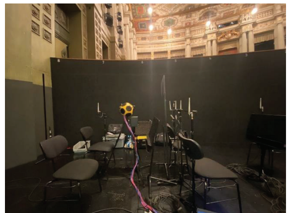
Abbildung 4: Versuchsaufbau Vergleichsmessungen im Orchestergraben

Ergänzend dazu wurden Vergleichsmessungen im Orchestergraben des Prinzregententheaters in München durchgeführt (Abbildung 4).