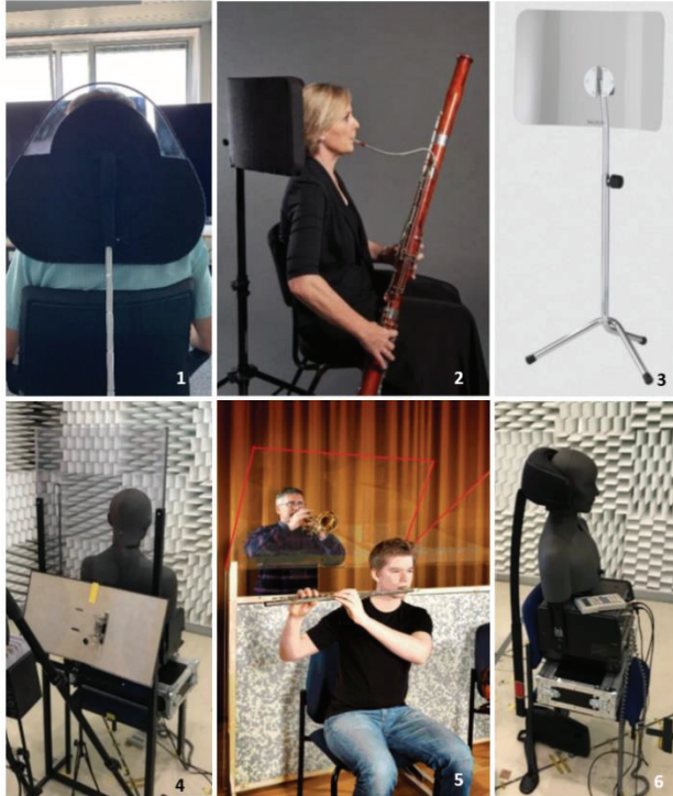
Abbildung 2: Querschnitt der untersuchten individuellen Schallschirme.

Für die Musiker, für die diese Gehörschützer als persönlicher Schallschutz nicht geeignet sind, wurde die Möglichkeit der Nutzung von persönlichen Schallschirmen untersucht [5]. Dabei sollte auf aktuell schon verwendete oder kommerziell vertriebene Schallschirme zurückgegriffen werden (Abbildung 2).