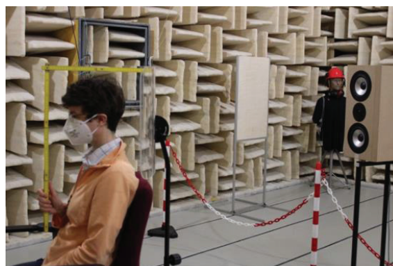
Abbildung 6: Bestimmung der Schirmwirkung eines Kolberg-Schallschirmes im Labor des IFA in Anlehnung an die Baumusterprüfung nach DIN EN ISO 4869-1

Auch hier wurde bei tiefen Frequenzen keine wesentliche Schutzwirkung festgestellt. Die Pegelreduzierung begann bei den kleinen Schirmen ab 1000 Hz und beim großen Schallschirm der Staatsoper München bei 500 Hz. Bei 4000 Hz wurden Schalldämmwerte um 10 dB erreicht.