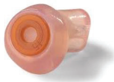
Abbildung 1: Musiker-Gehörschutz Elacin ER 15®

Dadurch sind auch Gehörschützer mit flacher Dämmkurve für einen Teil der Orchestermusiker keine Möglichkeit, ihr Gehör gegen Schalleinwirkung zu schützen.